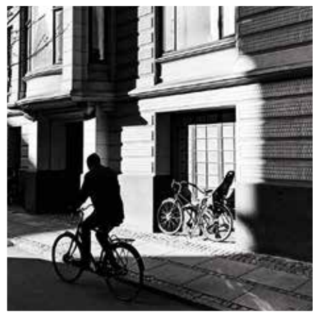
@justhanni: Copenhagen Classics