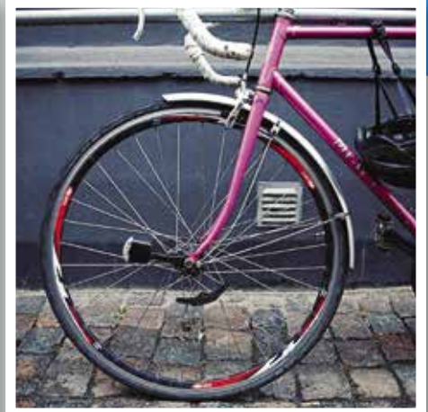
@cykelninja: A closer look at a pink beauty