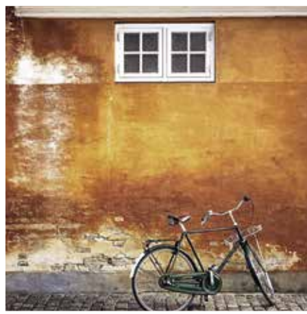
@kimahm_cph: Tourist de Luxe